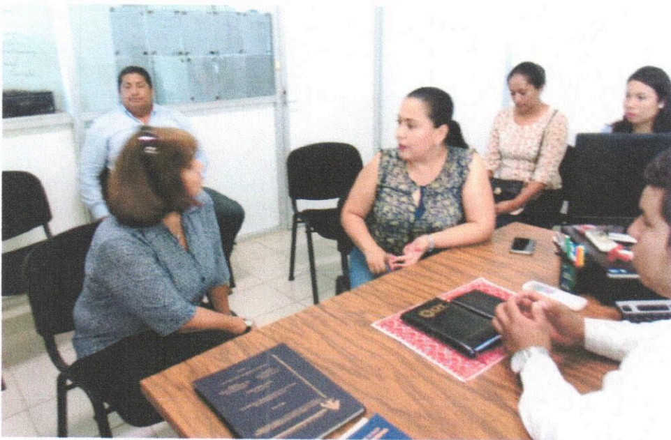
Reunión de trabajo con la presidenta Municipal del municipio de Benemérito de las Américas, Chiapas.