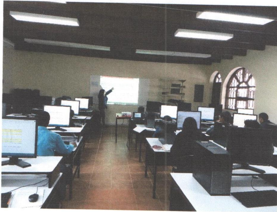
Fotografías del curso taller “Estudio Económico-Financiero y Evaluación Financiera de Proyectos de Inversión”. Impartidas en instalaciones de la Universidad Intercultural de Chiapas (UNICH).