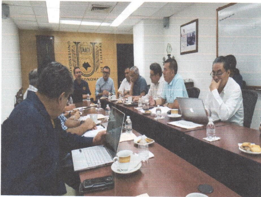
Primer Encuentro de Institutos y Centros de Investigación 2018