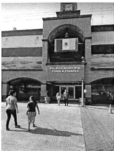
Figura 1- Palacio Municipal Tonalá

2019 “Año del Caudillo del Sur, Emiliano Zapata”