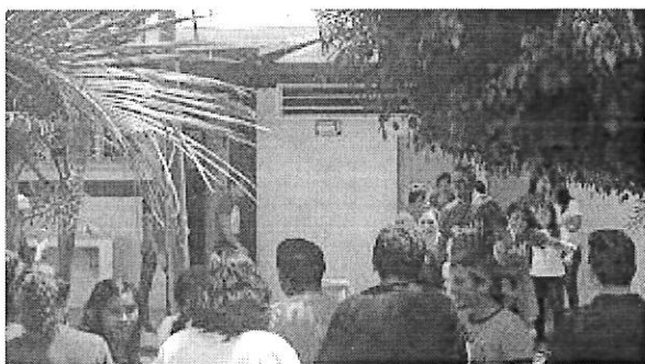
Figura 2-Instalaciones Prepa 1 Ocozucuahtla