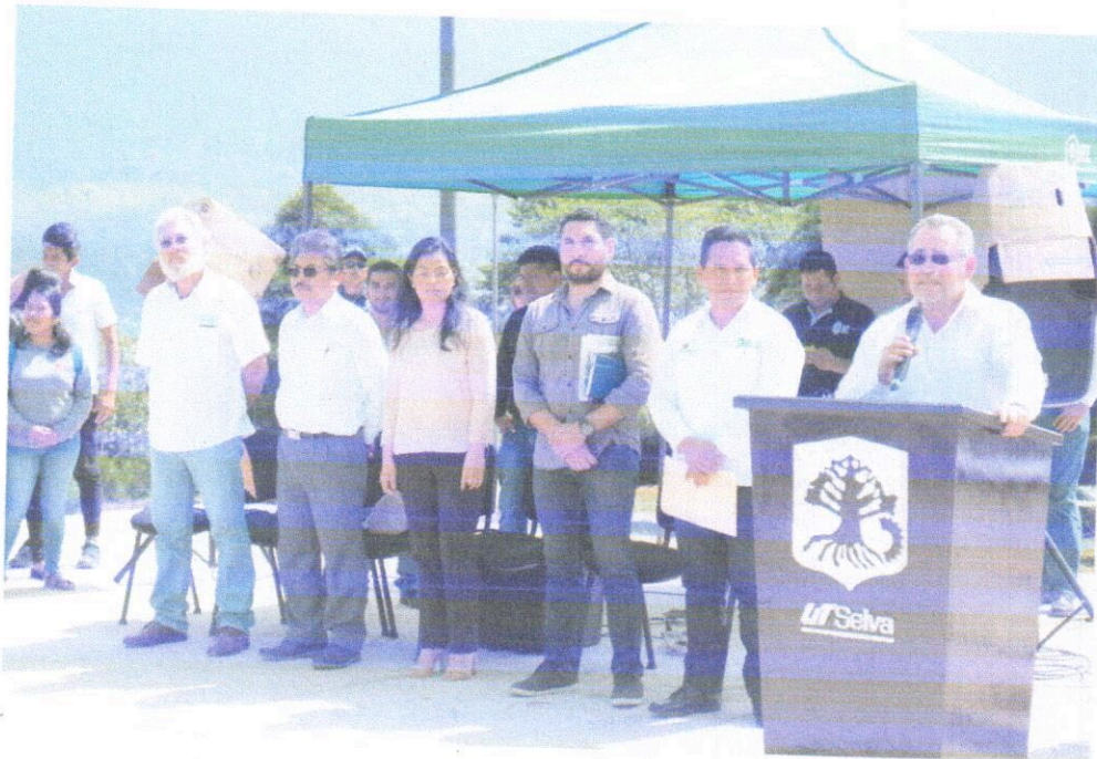
Reunión con alumnos, personal docente y administrativo de la Unidad Académica de Rayón, el día 05 de febrero de 2019.