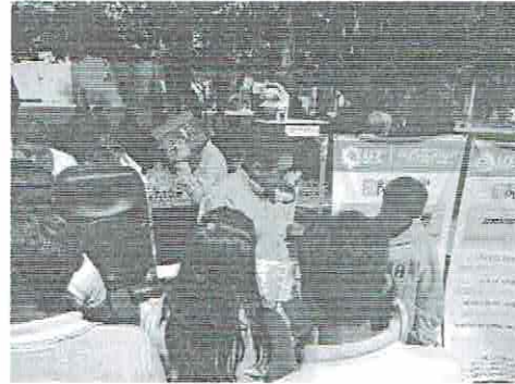
Imagen 02. Promoción.