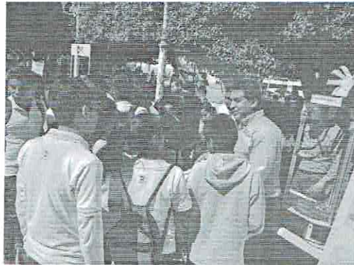
Imagen 03. Promoción.