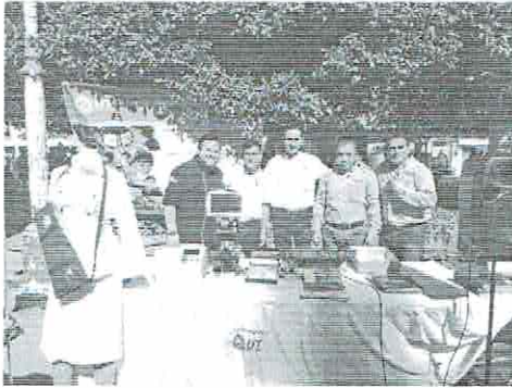
Imagen 01. Montaje del Stand.