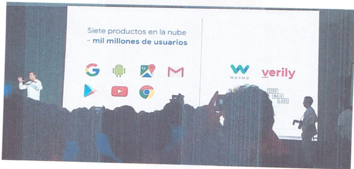
Tercera conferencia La visión de google en Educación y Seguridad en línea. Conferencia impartida por el Gerente de cuentas de Educación Básica y Sector Público de Google.