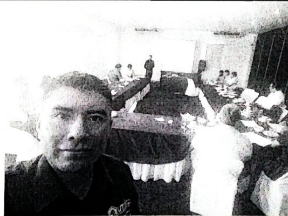
Fotos de la participación en el taller de Análisis Situacional del Trabajo para la carrera de Técnico Superior Universitario especialidad desarrollo de software multiplataforma