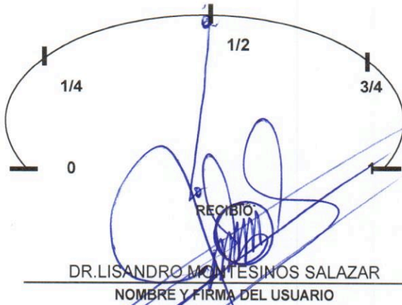
NIVEL DE COMBUSTIBLE (ENTREGA DE VEHICULO)