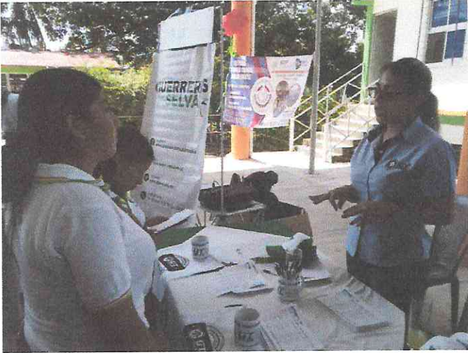
Feria profesiografica CECyTE plantel 19, Palenque Chiapas.