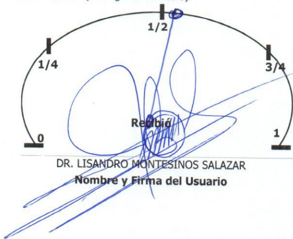
Nivel de Combustible (Entrega de Vehículo)