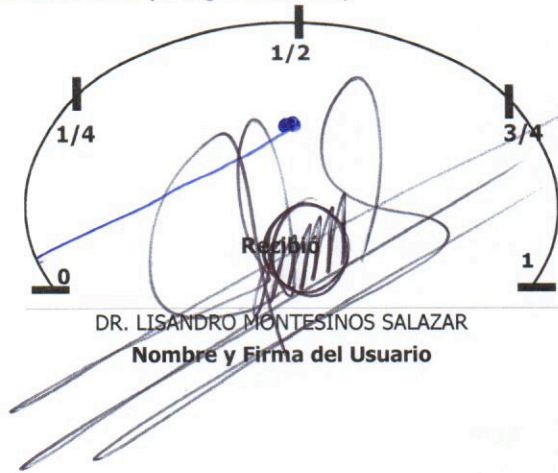
Nivel de Combustible (Entrega de Vehículo)