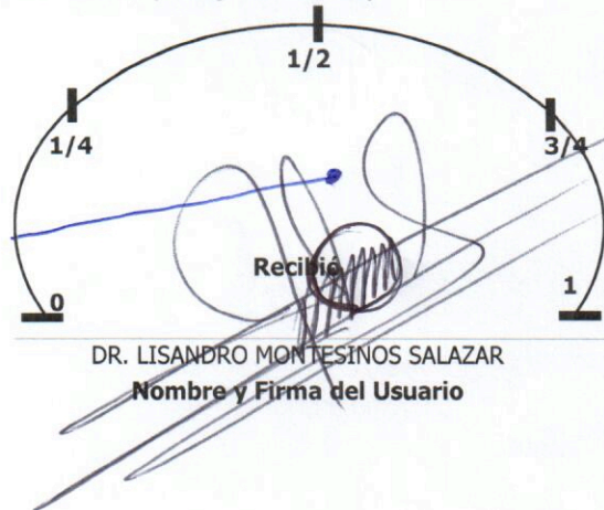
Nivel de Combustible (Entrega de Vehículo)