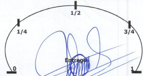
Nivel de Combustible (Recepción de Vehículo)