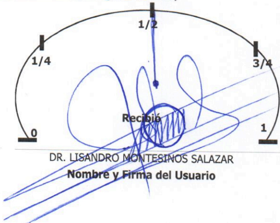
Nivel de Combustible (Entrega de Vehículo)