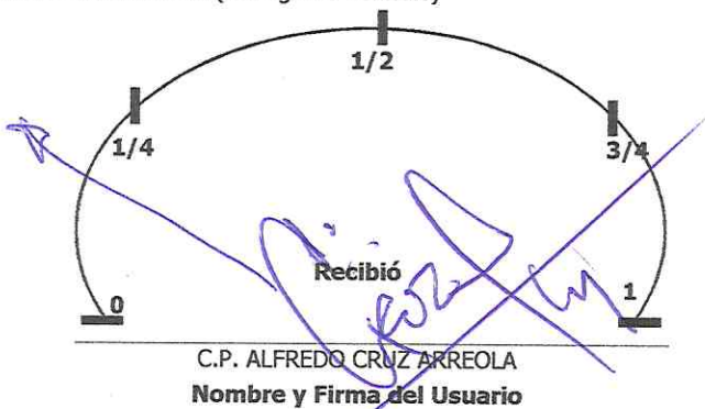
Nivel de Combustible (Entrega de Vehículo)