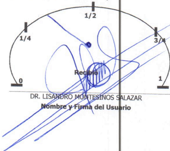
Nivel de Combustible (Entrega de Vehículo)