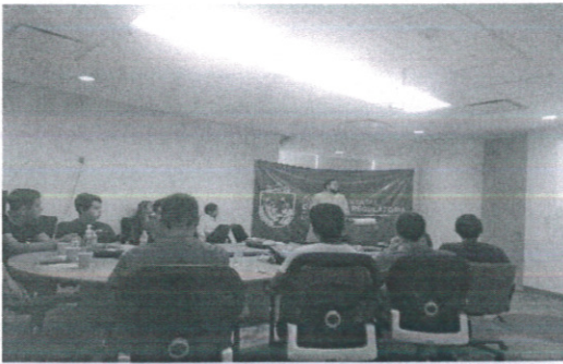
SECRETARÍA DE ECONOMÍA