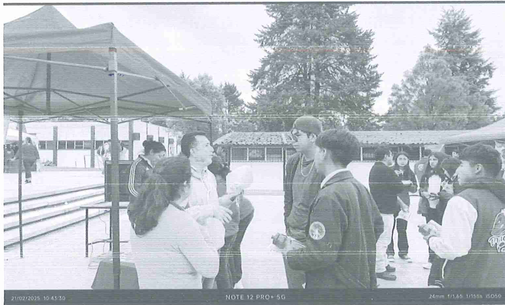
Fig. 4.- Cada docente atendiendo a un grupo de alumnos.

Cabe mencionar que a pesar que se presentaron varias universidades, la mayoría privadas la UTSELVA fue visitada varias veces durante todo el tiempo y se le dio a los alumnos mas interesados una hoja para que llenaran sus datos y poder mandarles mas información de la carrera en especifico que ellos les interesa.