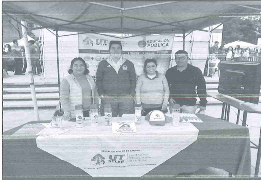
Fig. 2.- Instalación de los materiales de promoción

La actividad de promoción se llevo en el horario de 9 a 1pm, al termino de la exposición de la información de la universidad se opto por guardar todo, agradecer a la escuela CBTIS 92 y solicitar el sello en la hoja de comisión.