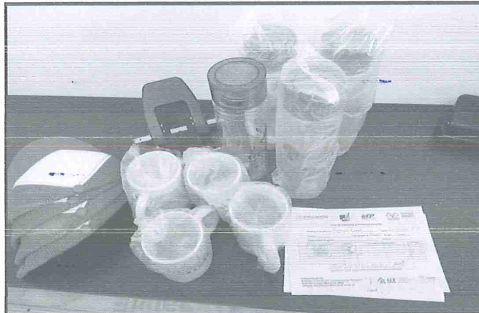
Fig. 5.- Entrega de 4 gorras, 4 botellas y 4 vasos

hoy 24 de febrero lunes, entrego ese material sobrante al encargado de la division de construccion.