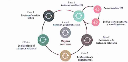
Ciclo de integralidad de la evaluación y mejora continua del SEAES

educativo a realizarlo, además, el ciclo de integralidad de la evaluación y mejora continua del SEAES, explicando en qué consiste cada una de ellas.