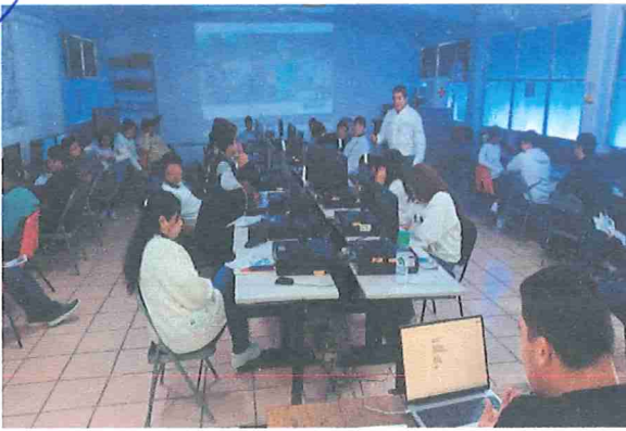
Visita para el Plantel Cobach No. 25 ubicado en Chilón, Chiapas