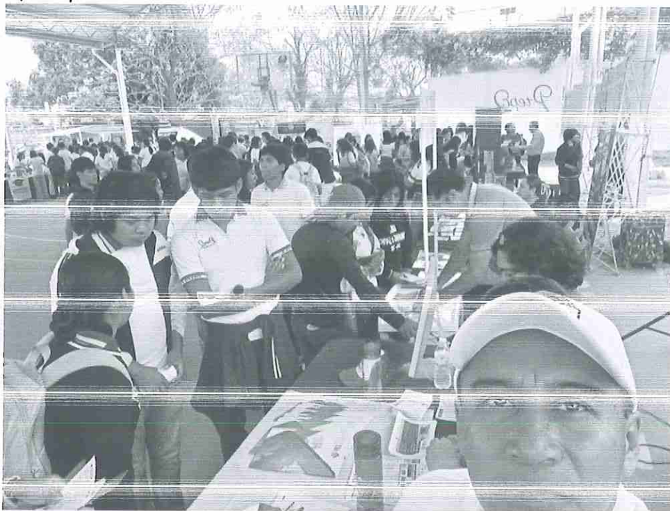
Fotografías de la Feria Profesiográfica 2025 de la Preparatoria #2, de Ocosocoautla de Espinoza, Chiapas.