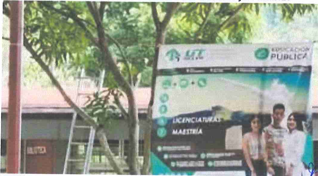
Evidencia fotográfica de la COMISIÓN UTS/DEU/DPyD/0121/2025