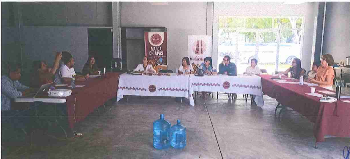
Evidencia fotográfica de la COMISIÓN UTS/SA/DAgA/018/2025