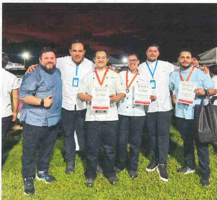
Fotografía de evidencia. Participación y premiación de concurso. Halachó, Yucatán.