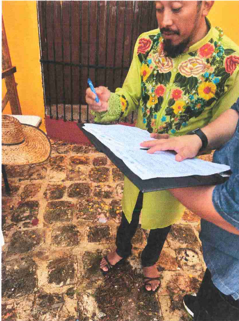
Fotografía de evidencia. Firma de comisión, por organizador del evento. Halachó, Yucatán.