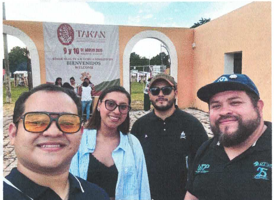
Fotografía de evidencia. Llegada a Festival TAK'AN. Halachó, Yucatán.