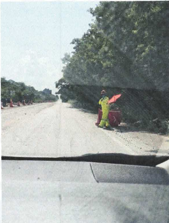
Fotografía de evidencia. Mantenimiento y obras de la carretera. Traslado Ocosingo-Mérida y viceversa.