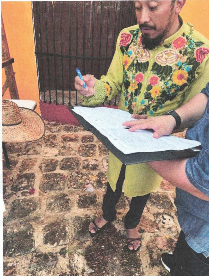
Fotografía de evidencia. Firma de comisión, por organizador del evento. Halachó, Yucatán.