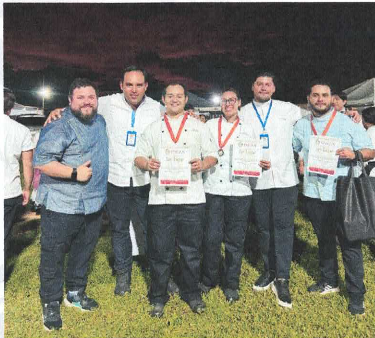
Fotografía de evidencia. Participación y premiación de concurso. Halachó, Yucatán.