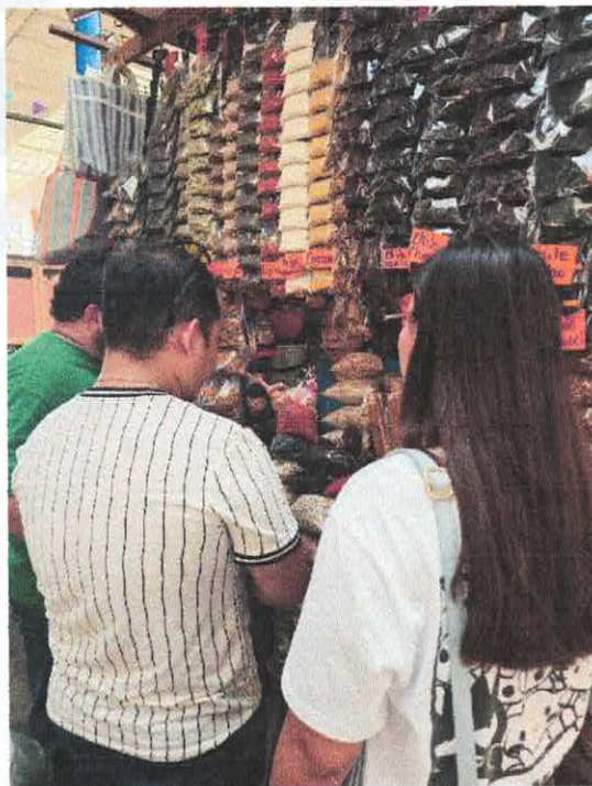
Fotografía de evidencia. Compras Mercado San Benito. Mérida, Yucatán.