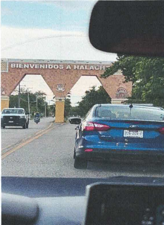
Fotografía de evidencia. Llegada a Halachó. Traslado Mérida-Halachó, Yucatán.