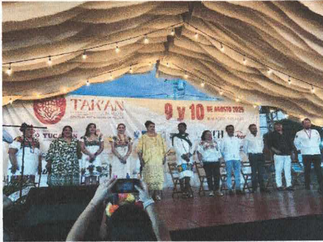
Fotografía de evidencia. Inauguración del Festival. Halachó, Yucatán.